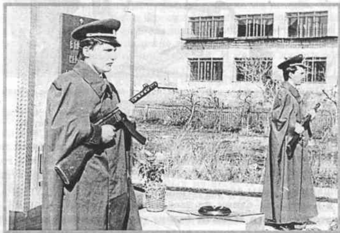
Ежегодно 9 мая в Почетный караул у обелисков встают школьники

Конечно, мы не могли не включить в книгу и очерки, рассказы, сочинения о тех, кто ковал победу на фронте и в тылу. Из них мы узнаем, как, казалось бы, из маленьких подвигов ковалась большая Победа. Внуки и правнуки в своих сочинениях рассказали о своих родственниках, участниках войны, и это значит, что память живет среди сегодняшней молодежи. О войне они узнают в музеях, на классных и школьных мероприятиях, от своих родителей.